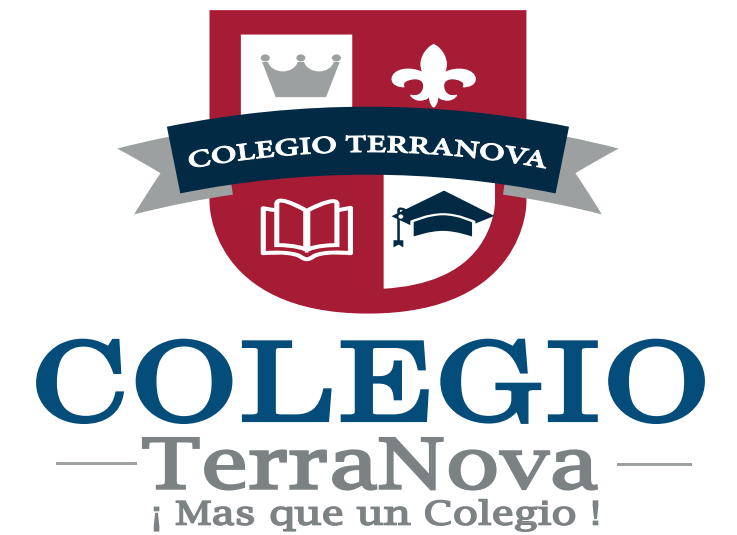
Distorsión en su proporción horizontal.