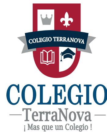
Distorsión en su proporción vertical