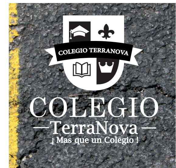
SOBRE ENTORNO FOTOGRÁFICO OSCURO