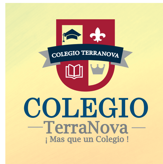
SOBRE ENTORNO FOTOGRÁFICO CLARO