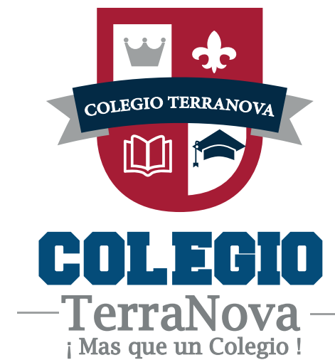
Cambios en la tipografía