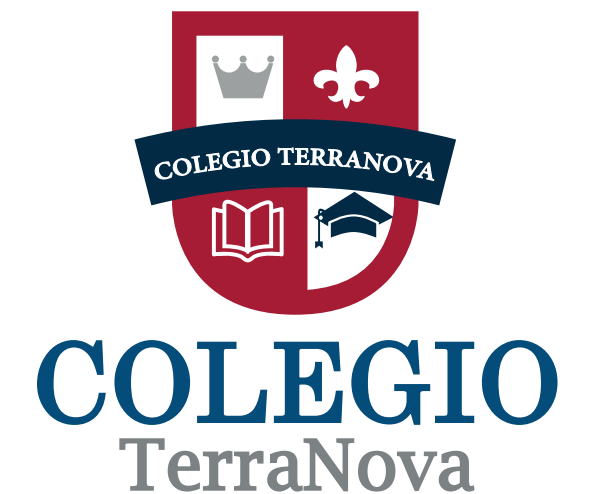
Eliminación de elementos del logotipo