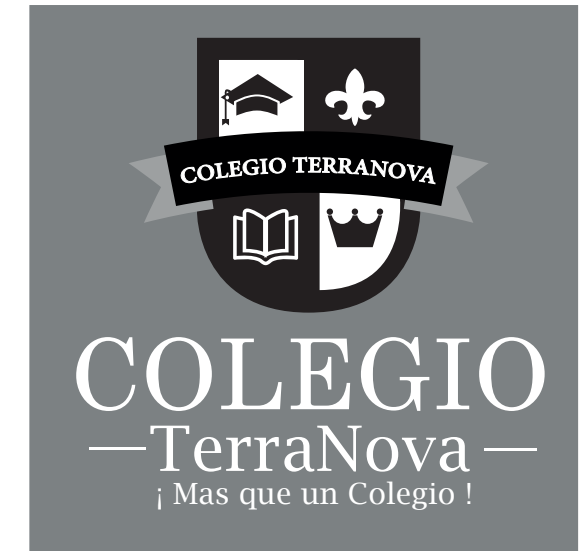
BLANCO Y NEGRO FONDO GRIS LOGO CON INTERVENCIÓN DE 100 %