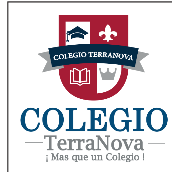
NEGRO SOBRE BLANCO LOGO COLORES