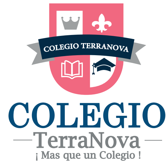
Cambios en los colores