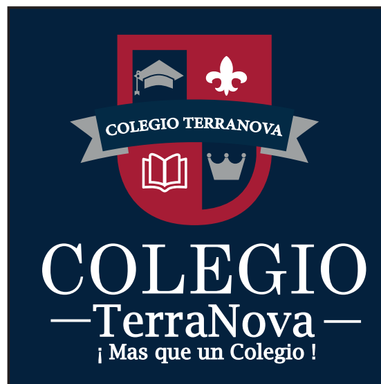
SOBRE AZUL CORPORATIVO