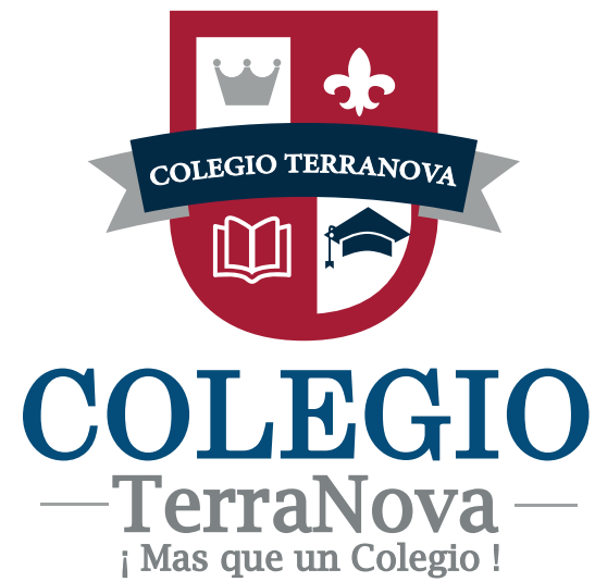
Cambios en la distribución de los elementos

Se recomienda un especial cuidado en evitar usos no correctos que afectan a al imagen de la Identidad Corporativa